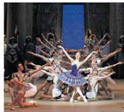
The Pharaoh's Daughter