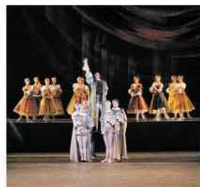
Romeo and Juliet