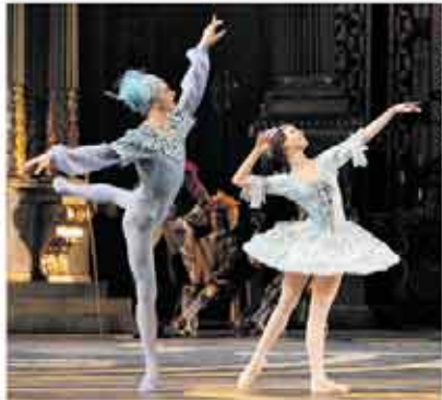
The Sleeping Beauty