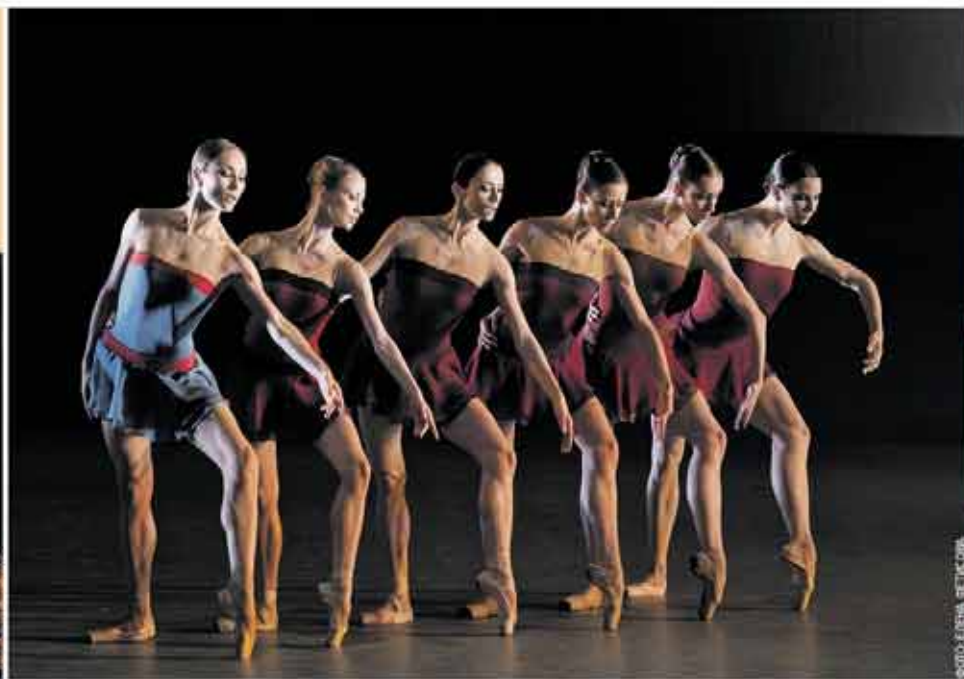
БАЛЕТЫ «КЛАССИЧЕСКАЯ СИМФОНИЯ» И «DREAM OF DREAM» 29 июня 2012 года Юрий Посохов, не первый раз сотрудничающий с Большим, перенес в Москву свой балет 2010 года, а Йорма Эло поставил оригинальный спектакль.