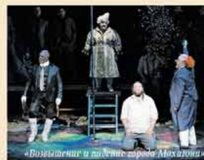
«Возвышение и падение царя Михаила»