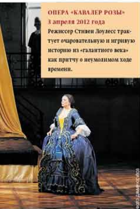
ОПЕРА «КАВАЛЕР РОЗЫ» 3 апреля 2012 года Режиссер Стивен Лоулесс трактует очаровательную и игривую историю из «галантного века» как притчу о неумолимом ходе времени.