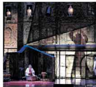
The Fiery Angel

After the Bolshoi's historic building re-opened it was both appropriate and spectacular to invite the world's best music theaters to perform on its stage. The arrival of the orchestra conducted by Daniel Barenboim and La Scala Theatre Chorus, which performed Verdi's Requiem , was the great start for putting the idea into action. Soon afterwards the stage hosted the Milanese ballet company, which performed Excelsior and A Midsummer Night's Dream . It was during the 236th season that Madrid's Teatro Real performed on the Bolshoi's stage for the first time, presenting Kurt Weill's Rise and Fall of the City of Mahagonny , which had never been staged in Russia.