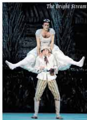
The Bright Stream