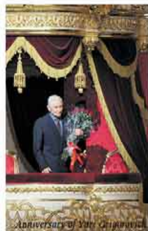
Anniversary of Yuri Grigorovich