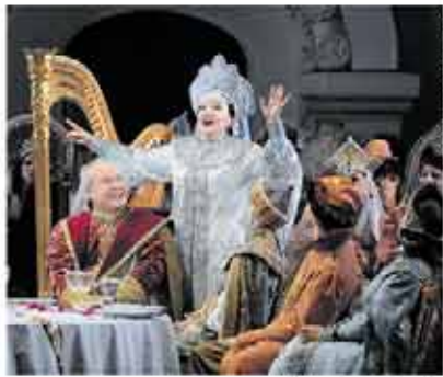
Ruslan and Lyudmila