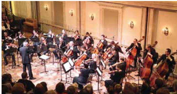
Камерный оркестр Большого театра Дирижер МИХАИЛ ЦИНМАН The Bolshoi Theatre Chamber Orchestra Conductor MIKHAIL TSINMAN

18, 20 (12:00 и/and 19:00), 21 (12:00) ОКТЯБРЯ / OCTOBER; 25 (12:00) НОЯБРЯ / NOVEMBER; 22 (12:00), 23 (12:00) ДЕКАБРЯ / DECEMBER 2018; 8 (12:00), 9 (12:00), 17 ФЕВРАЛЯ / FEBRUARY; 14, 16 (12:00 и/and 19:00) МАРТА / MARCH; 4 (12:00) МАЯ / MAY; 1 (12:00 и/and 19:00), 2 (12:00) ИЮНЯ / JUNE 2019